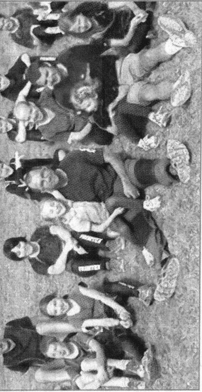
Les adhérents de Caponord ont entre 5 et 65 ans.

Site Internet : www.caponord-sports-orientation.fr Historique : À l'origine, il se nomme le Grande-Synthe Orientation. Mais, il est devenu Caponord, car les terrains d'entraînement se situent sur toute l'agglomération. Comme ses adhérents.